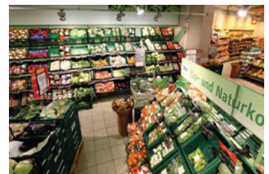
Bild 2

(Umwelt-)Bewusst Einkaufen: Mehr pflanzliche Produkte, bevorzugt aus Bio-Anbau, sind klimafreundlicher und helfen, gesund zu bleiben.