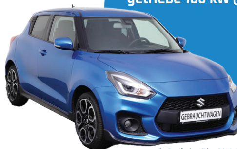
Außenfarbe: Blau Metallic