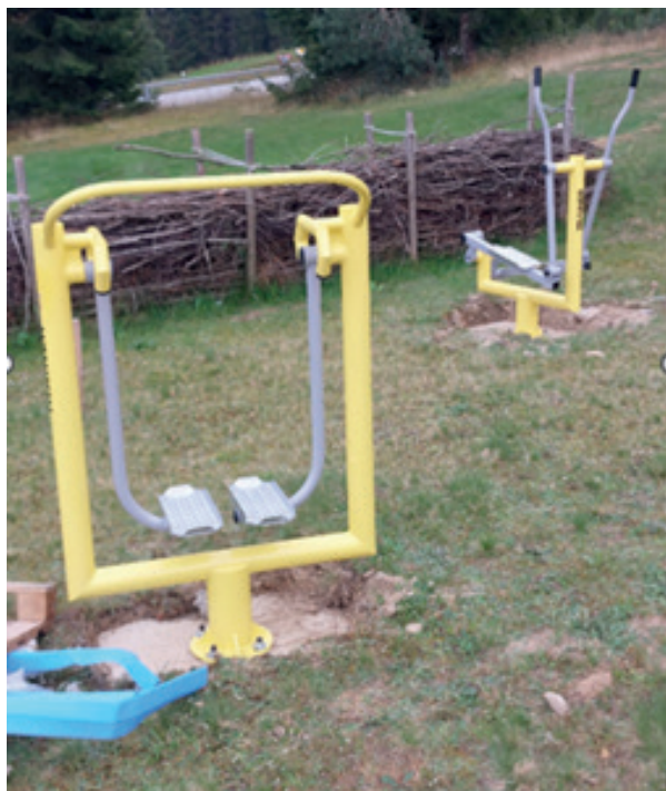
Station am Mehrgenerationenplatz

Verantwortlich für das Projekt war die Arbeitsgruppe Bürger für Bürger, Philippsreut.