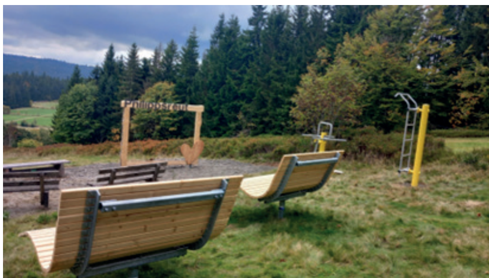
Station am alten Skilift in Philippsreut

Wir freuen uns auf die Nutzung durch alle Gemeindebürger und Gäste.