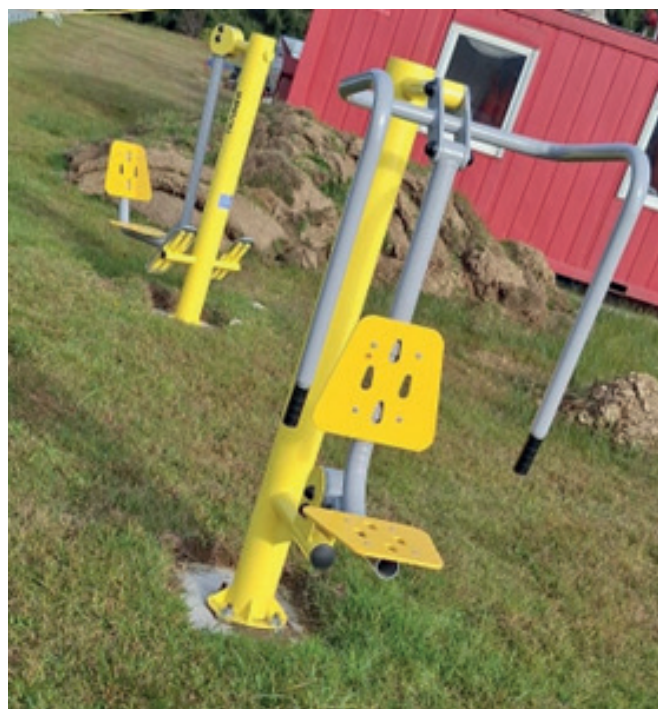
Station am Sportplatz in Philippsreut